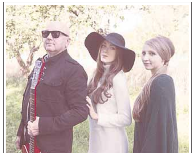
Das Mimi Balu Trio.